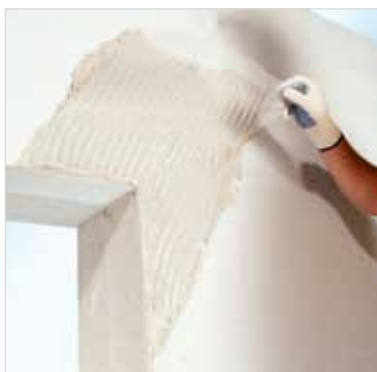
Aplikácia diagonálnej výstuže