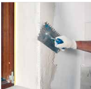
Inštalácia rohového profilu

NPD = nebolo stanovené Platný sortiment a expedičné údaje pozri aktuálny cenník.