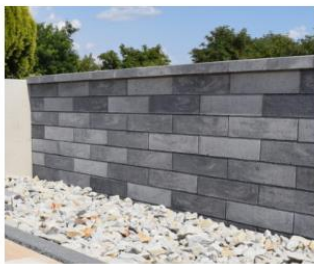
Plot Metropol Uni, farba granito