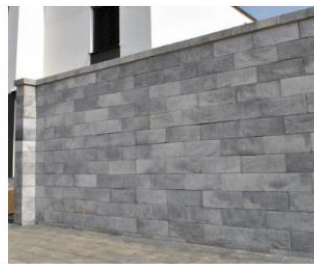
Plot Duvar light, farba granito