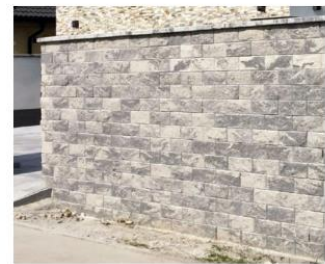
Plot Casser, farba granito

Odtieň granito v troch rôznych plotových systémoch vytvára pri každom oplotení iný finálny výsledok, ktorý je závislý od druhu a veľkosti tvárnic, ale aj od povrchovej úpravy daného typu plotu. Pri dodávke produktov v prevedení colormix sa na palete môžu nachádzať tvárnice s výraznejšou kresbou a aj tvárnice, kde farebné prechody sú nepatrné, vždy ide o mix niekoľkých farieb.